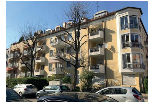
Nachbarschaft in der Stadt – automatisch anonym?

das Geländer komplett in den ersten Stock zu heben, fehlten gute zwei Meter. Ich klingelte bei den Nachbarn, die auch gleich öffneten und mit den Worten „das haben wir uns schon gedacht, dass das eng wird“ uns mit dem Teppich in ihre Wohnung ließen. So konnten wir ihn über das Geländer heben, aus dem Fenster im ersten Stock hinaus wandern lassen und somit in meine Wohnung bringen. So habe ich meine Nach-