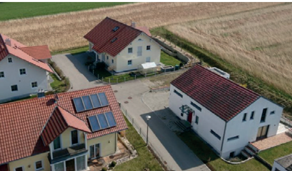
Nachbarschaft auf dem Land – automatisch voll integriert?

habt, mich bei den Nachbarn in der Straße als der „Neue“ vorzustellen. Ich merke noch heute, wie wichtig das war und wie ich dadurch auch gut in die Gemeinschaft meiner Straße aufgenommen wurde. Sehr gefreut hatte ich mich und fühlte mich da im Dorf angekommen, als ich von